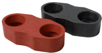
MT2.78x1x3xCT.BK SureLok Connector Black - Mat to Mat Connector

* Sizes are approximate | * Some colors require minimum quantities