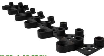
MT2.78x4x18.CT.BK Anti-Fatigue Drainage Mat to MT2 Tile Connector